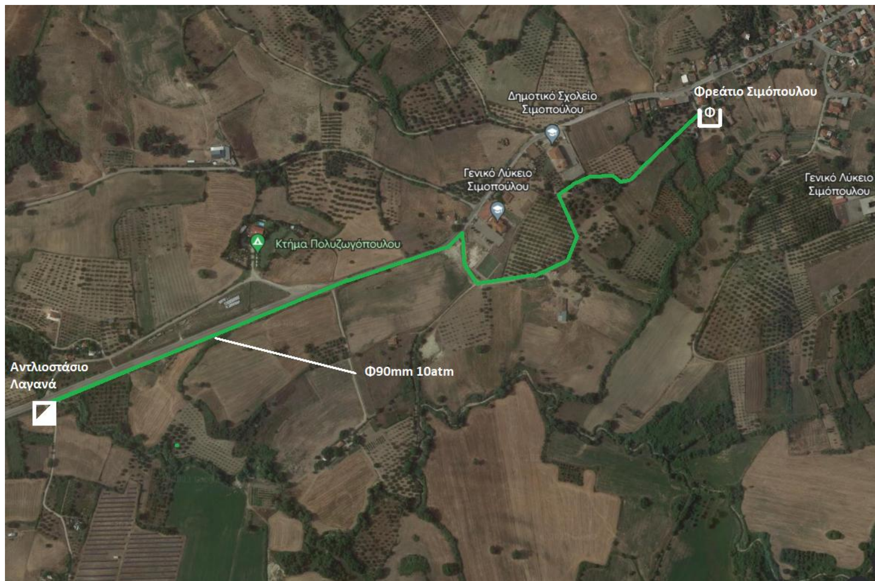
Εικόνα 2. Σύνδεση αντλιοστασίου Λαγανά με φρεάτιο Σιμόπουλου.